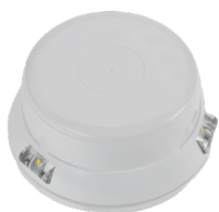
Witte afdekkap (LID100-SG/W)