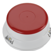
Rode afsluitdop (LID100-SG/R)